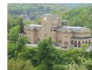
Художествена галерия "Борис Денев"

Начало &gt; Новини &gt; Представиха проект "Традиционното и модерното в културата и изкуството"