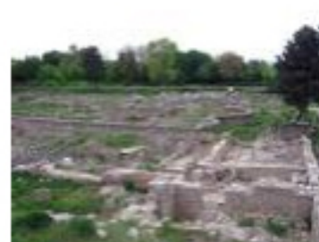
Античен град Нове