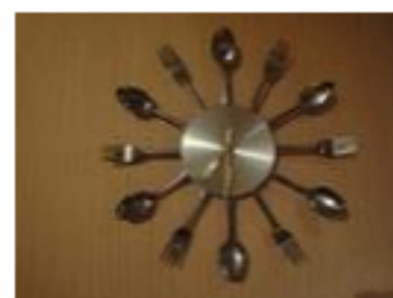
Ресторант Щастливеца 1